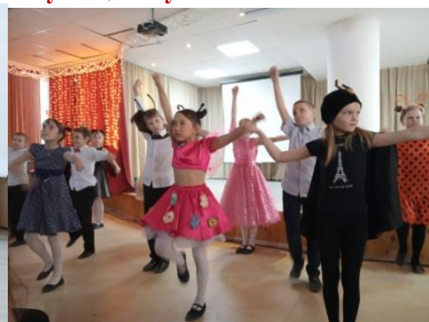
4 А класс (Шпак Ю.В.) – «Черная курица, или Подземные жители»