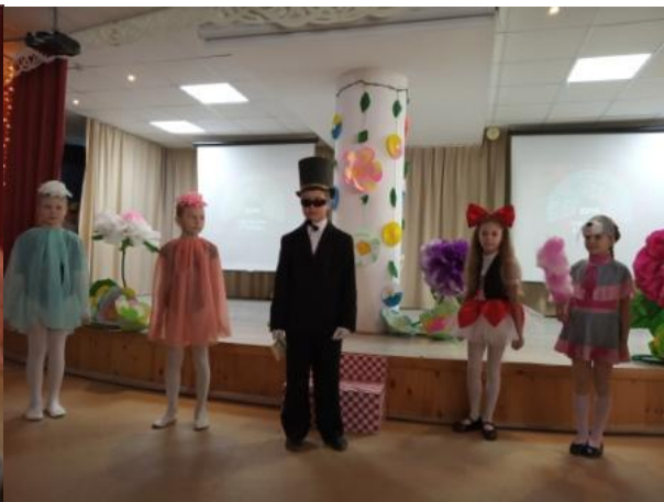
2 Б класс (Мухина Ю.В.) – сказка «Снежная королева»